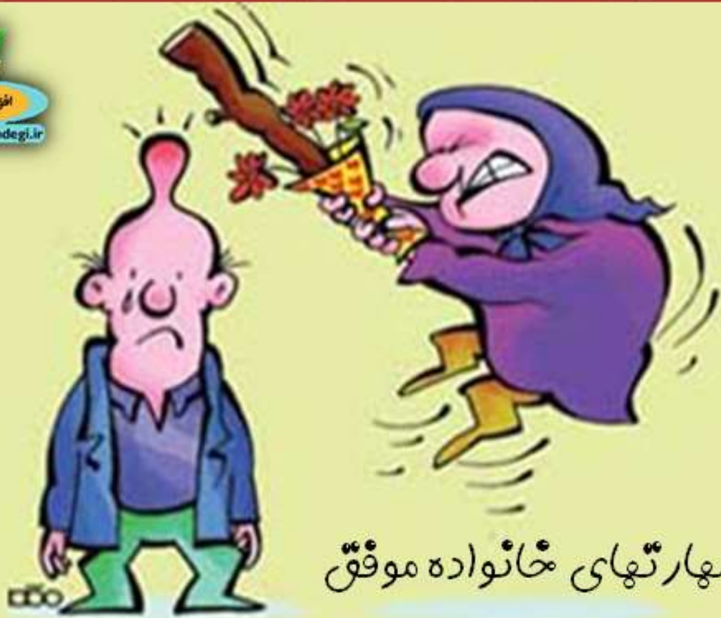
مهارت‌های خانواده موفق